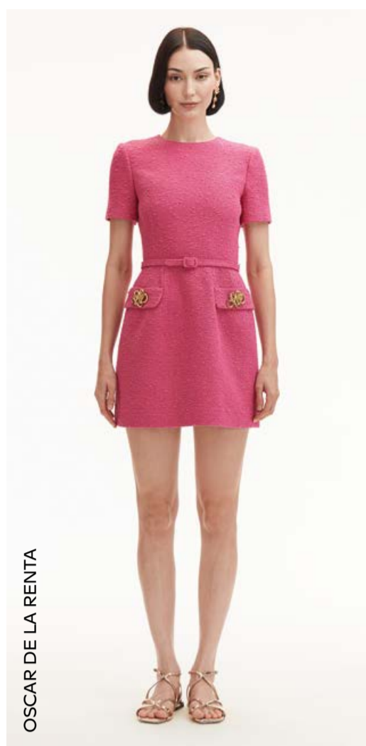
OSCAR DE LA RENTA